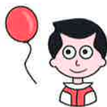
Ubezpieczenia NNW dla Dzieci

UBEZPIECZENIE z rabatem 10% na www.bezpieczny.pl