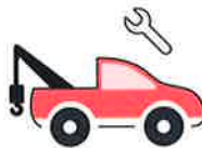
Assistance w Podróży